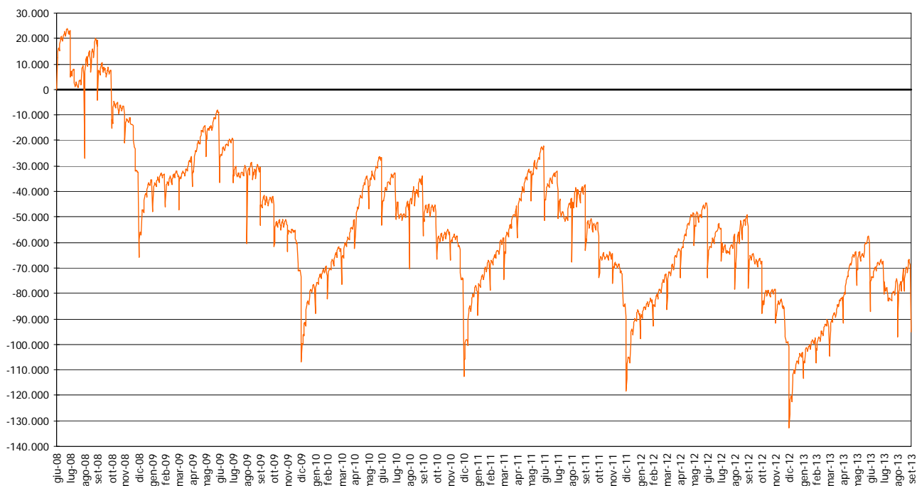
Graf. 1.1 – Veneto. Posizioni di lavoro dipendente* Variazioni cumulate rispetto al 30 giugno 2008. Dati giornalieri

* Al netto del lavoro domestico e del lavoro intermittente.